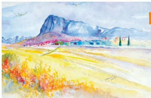
Le vol à voile du Pic Saint-Loup – Atelier Lancelot Dulac

Au cœur du Mas-de-Londres découvrez, dans l'ancienne école du village, l'atelier de Lancelot Dulac qui sillonne la France avec ses pinceaux... Cette exposition est un voyage artistique révélant les trésors d'un patrimoine parfois insoupçonné.