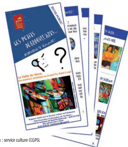
Illustration & conception : service culture CCGPSL

Les Petits Débrouill'Arts t'attendent pour relever le défi et résoudre les énigmes de l'exposition de la Halle du Verre (Claret, p.8).